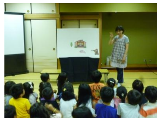
講座には遊びのお部屋(託児)もあります。 この日はパネルシアターにワクワク！