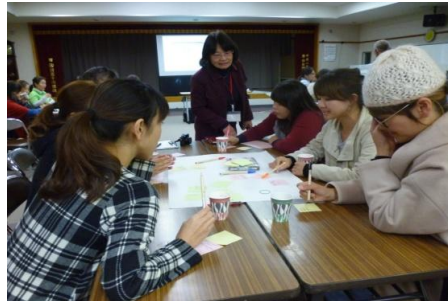
カフェ付きのグループワークでほんわか笑顔