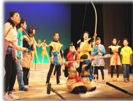
「時空の扉」(平成27年度)