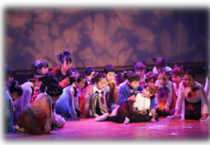
「百年の森」(平成26年度)

発足当時から地域の実行委員会と取り組んできた佐伯市の表現教育事業。来年2月には、国立教育政策研究所(東京都文部科学省所管)で「生涯学習の振興とまちづくり」の研究発表を行う予定です。全国にこどもミュージカルを通じた地域づくりを発信します。