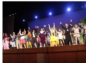
「ちよまとネコ会議」(平成28年度)

4年目は「ネバーランドと君と僕」 舞台を通じて成長する子どもたちの姿をぜひご覧下さい!